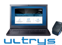
Kit de programmation ULTRYS et les protocoles SSCP® et OSDP™