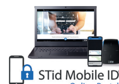
Plateforme Web pour une gestion à distance de vos badges virtuels

*Attention : informations sur les distances de communication : mesurées au centre de l'antenne, dépendant du positionnement du véhicule, de la configuration de l'antenne, de l'environnement d'installation du lecteur, de la tension d'alimentation et des réglementations locales admises. Des perturbations externes peuvent provoquer la diminution des distances de lecture. Les performances de lecture dépendent du positionnement du tag et du type de pare-brise. Les pare-brises athermiques peuvent altérer les performances de lecture. Il est impératif de placer le tag dans les zones d'épargne.