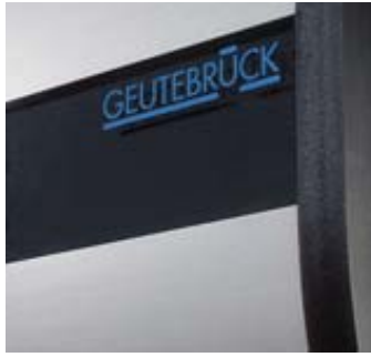
Panneau avant en aluminium.