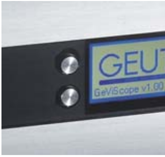
Touches de commande pour l'affichage du diagnostic.