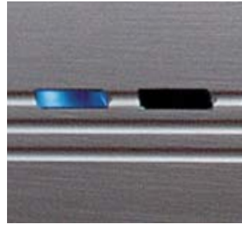
Mode de service directement visible.