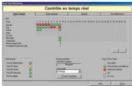
Logiciel de téléchargement gratuit sous WINDOWS