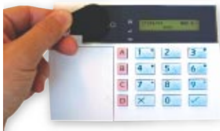
Clavier 9930 et 934