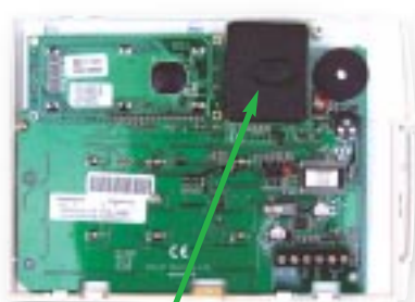
Intérieur clavier + module de proximité (934)