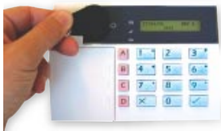
Clavier 9930 et 934