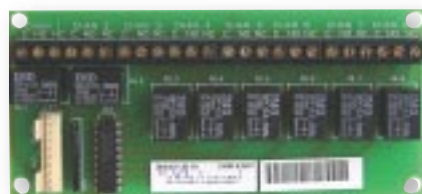
Carte de sortie 8600